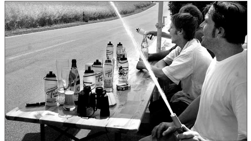
Wasser marsch: Zuschauer sorgen für willkommene Abkühlung.